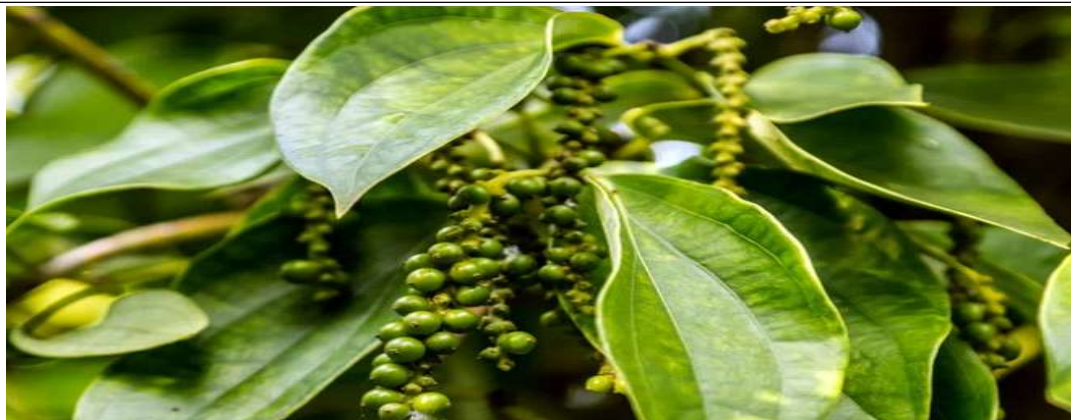
베트남 푸꾸옥섬에서 생산되고 있는 후추 사진