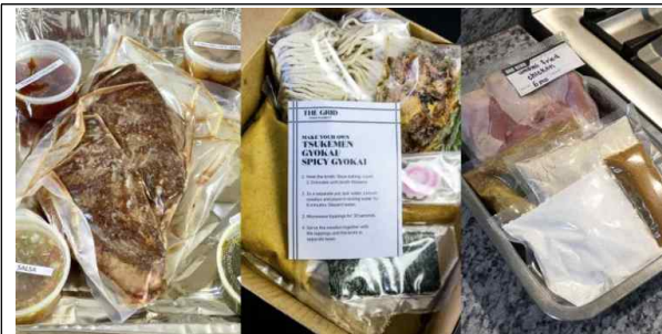
우동 MEAL KIT