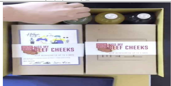
소고기 스테이크 MEAL KIT