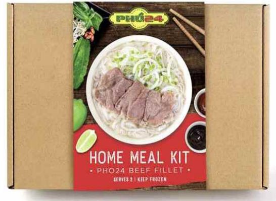
쌀국수 HMR 키트