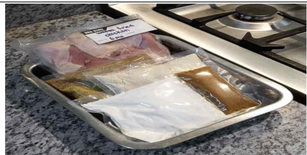
후라이드 치킨 MEAL KIT