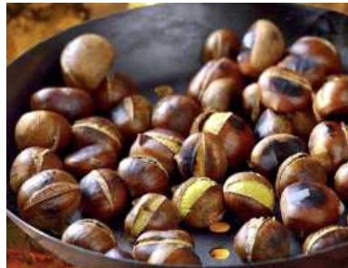
구운밤 (Hạt Dẻ Rang)