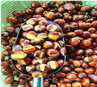
베트남산 둔갑 중국산 밤