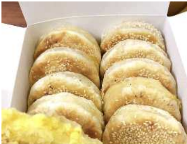
밤빵(Bánh Hạt Dẻ)