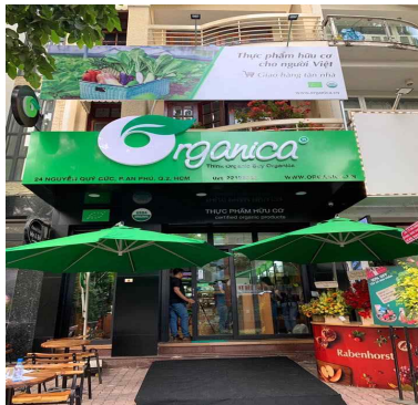
투득시 2군 매장