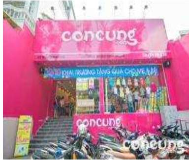
호치민 1군 매장