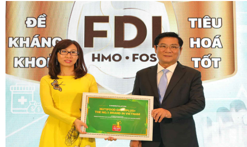
베이비밀크 브랜드 1위 타이틀