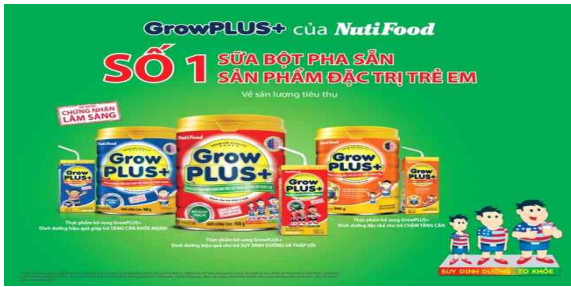
Grow Plus+ 제품