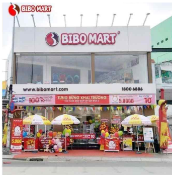
호치민 2군 매장