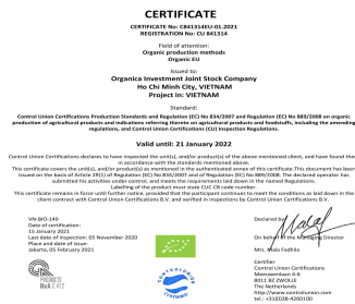
USDA, Euro-Leaf 인증서