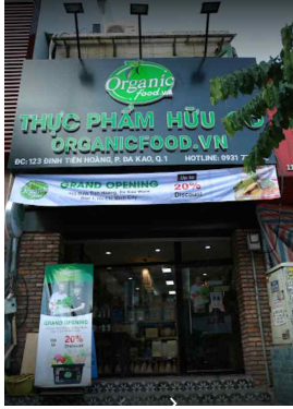
호치민시 1군 매장