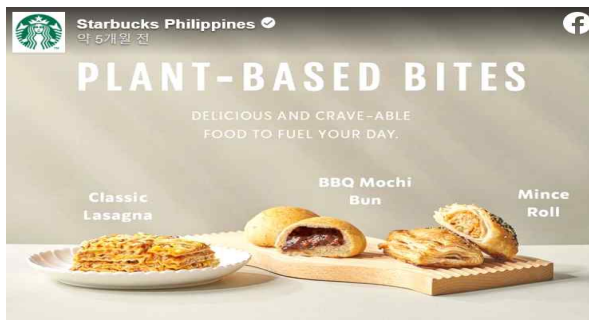
식물성 기반 식품