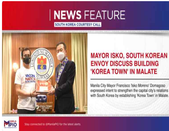
코리아 타운 조성 관련 뉴스 캡처