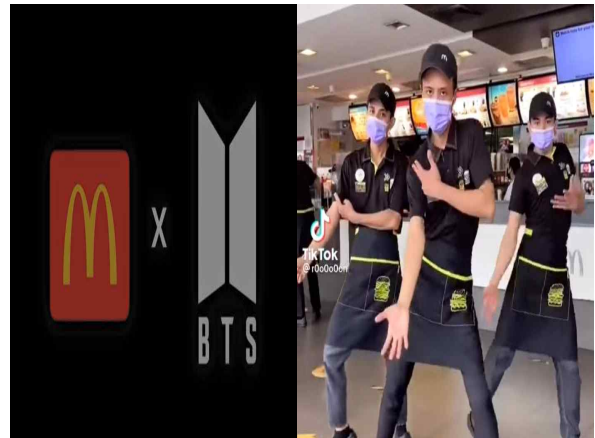
맥도날드x BTS 콜라보레이션