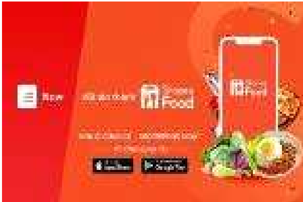
쇼피푸드 (Shopee Food) 상호변경