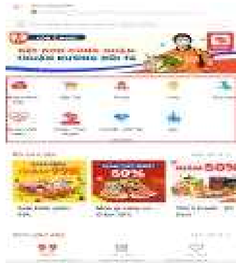
쇼피푸드 내 식품, 주류, 펫푸드 등의 카테고리