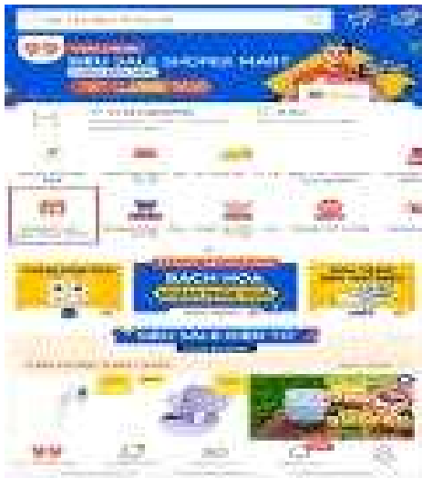
Shopee Food 카테고리 개설