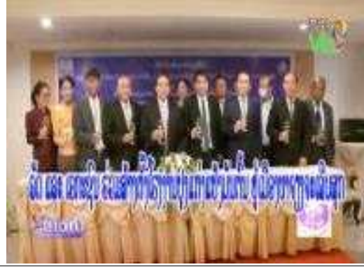
중국-라오스 농업 제품 무역협력 MOU 체결식