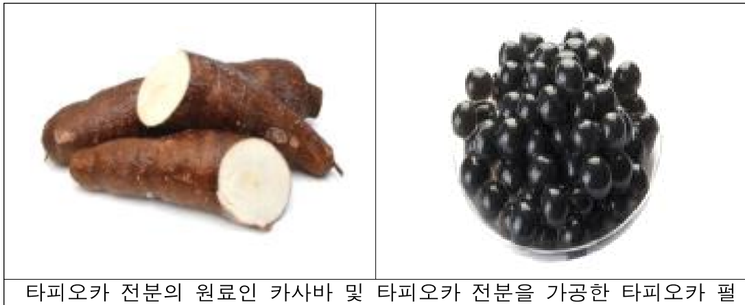
타피오카 전분의 원료인 카사바 및 타피오카 전분을 가공한 타피오카 펄