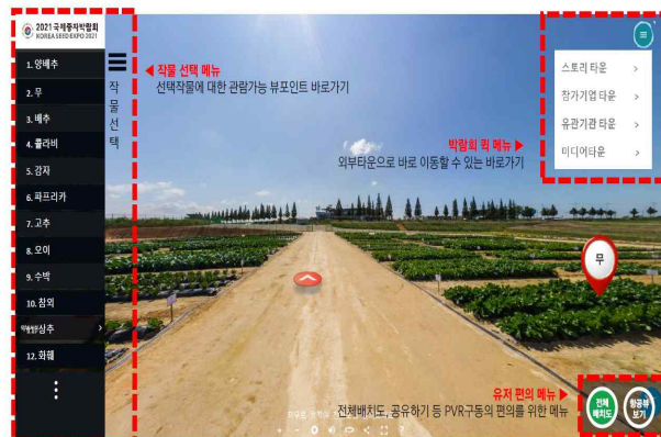
<파노라마 형식의 VR 전시포>

- 전시포 : VR 가상공간, 현장 스케치 동영상 등을 통한 전시작물 소개