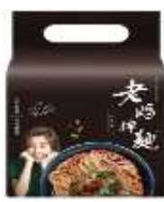
대만산 탄탄면 HKD61/129g*4