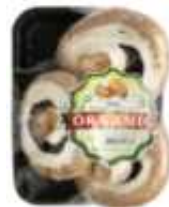
유기농 포타벨로 버섯 HK$36.9/250g