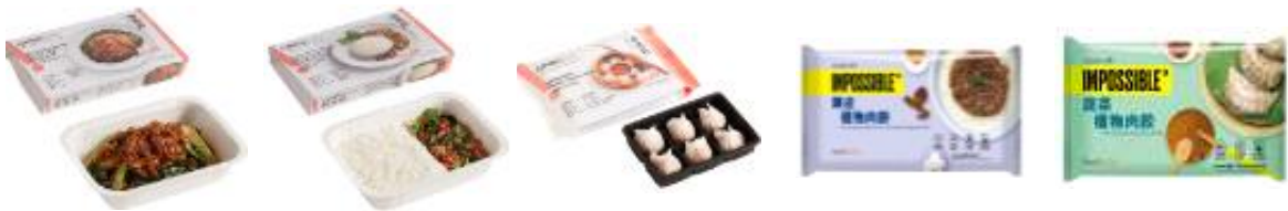
옴니포크 볶음면 HK$38/250g