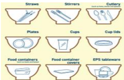
| 홍콩 정부가 금지하려는 플라스틱 식기의 종류 |