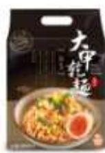
대만산 피기름 면 HKD54/122g*4