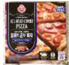
| 피자 | HKD56.9/425g