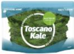
홍콩산 토스카노 케일 HK$35/125g