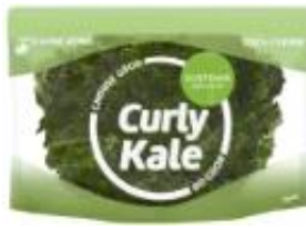
홍콩산 컬리 케일 HK$35/125g