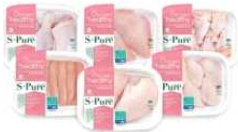
| 부위별로 세분화한 위생적인 포장 |