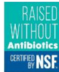
| 미국 위생협회의 무(無)항생제 인증 |