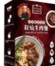
대만산 우육면 HKD55/600g