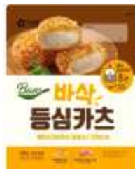
| 돈가스 | HKD53/320g