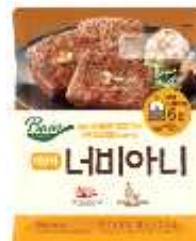
| 너비아니 | HKD75/390g