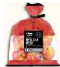
| 프랑스산 사과 |