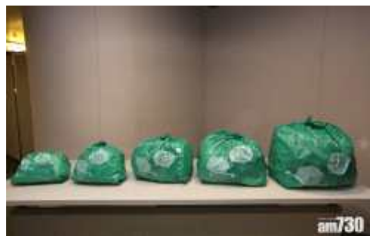
| 도입 예정인 지정 쓰레기 봉투 |