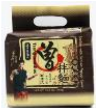
대만산 비빔면 HKD64/116g*4