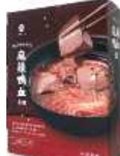
대만산 오리 선지 면 HKD57/450g