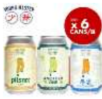
Young Master 홍콩산 수제 맥주 HKD145/330ml*6