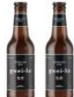
gwei lo 홍콩산 수제 맥주 HKD99/330ml*4