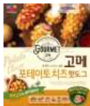
| 핫도그 | HKD63.9/400g