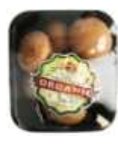
유기농 갈색 양송이버섯 HK$26.9/200g