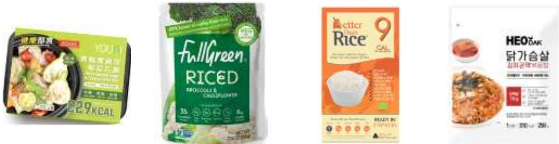
YOUNI/홍콩산 콜리플라워 밥 치킨 커리 HK$38/370g