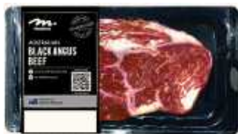
| 호주산 소고기 |