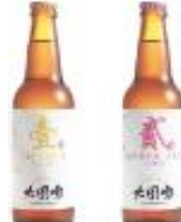
TAI WAI BEER 홍콩산 수제 맥주 HKD66/330ml*2