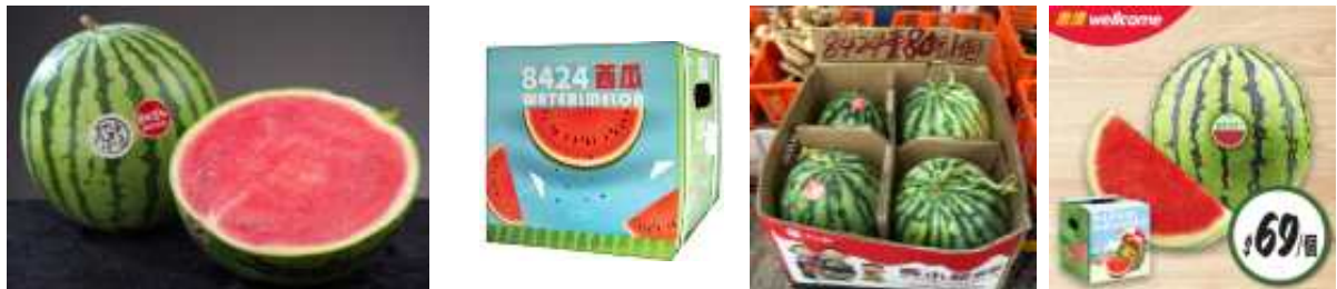
| 8424수박 |