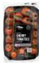
| 네덜란드산 방울 토마토 |