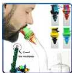
Wholesale colorful silicone mouthpiece NZ$6.80 - 8.67 / Piece