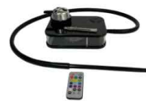
Black Small Acrylic Hookah NZ$60.00