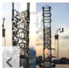
15.8inches Gravity Glass Bong Bubbler Hookahs NZ$50.26 - 61.50 / Piece