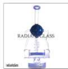
glass bong bent neck water tobacco pipe NZ$33.77 - 72.49 / Piece