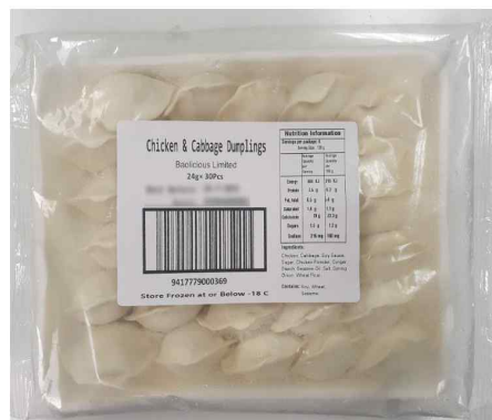
Baolicious brand Chicken and Cabbage Dumplings (24g x 30Pcs)