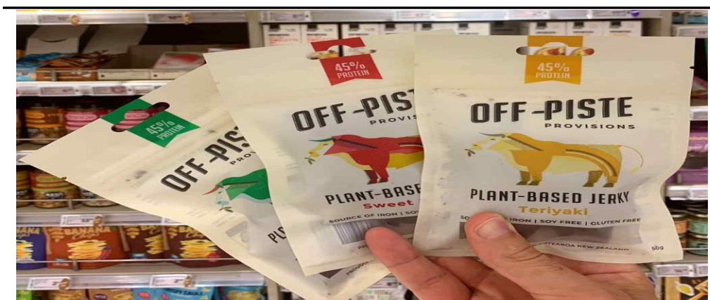
오프 피스트 프로비전스(Off-Piste Provisions)의 식물성 육포 제품