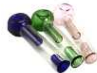
Paladin886 Y125 Hookah Smoking Pipe NZ$6.87 - 12.92 / Piece