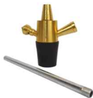
Yellow Hookah Stem Kit NZ$29.99