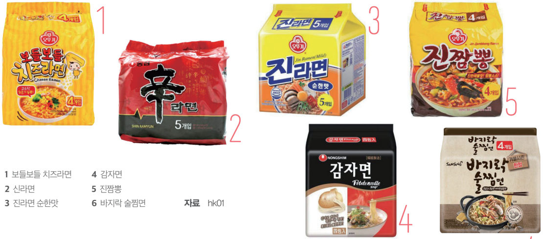
1 보들보들 치즈라면 4 감자면 자료 hk01 2 신라면 5 진짬뽕 3 진라면 순한맛 6 바지락 술짬면

매운 맛보다는 고소한 맛을 선호하는 홍콩 사람들의 입맛에 잘 맞는 라면인 것으로 풀이된다. 그 뒤를 이어 '신라면', '진라면 순한맛', '감자면', '진짬뽕' 등이 순위에 올랐다. 반면, 젊은 층에서 가장 핫한 라면은 '바지락 술짬면'인데 홍콩 사람들이 좋아하는 해물 베이스의 국물과 실제 바지락이 들어가 있다는 점에서 소비자들의 마음을 사로잡은 것으로 보인다. 홍콩 소비자들은 한국 라면에서 느끼는 매력을 "탱탱한 면발"이라고 답했다.