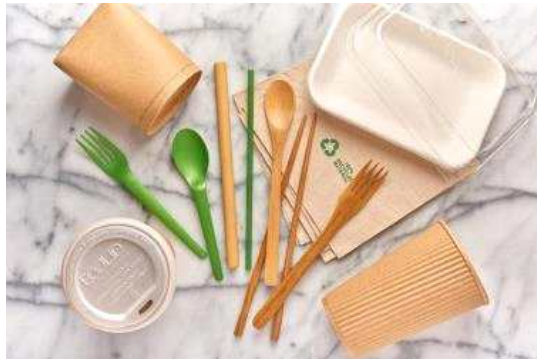
친환경 식품 포장재