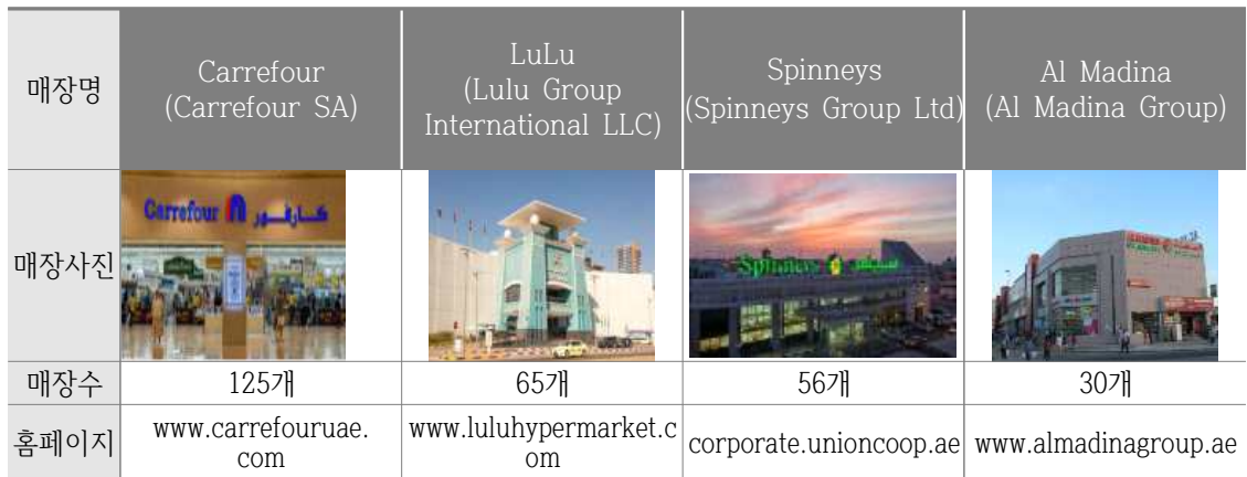
아랍에미리트 내 주요 하이퍼마켓·슈퍼마켓 브랜드