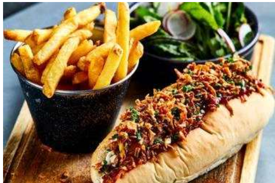
식물성 대체육으로 만든 음식