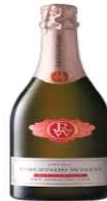
무알코올 스파클링와인 Robertson

* 사진자료 : robertsonwinery.com, asemangasht.com