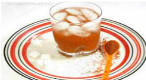
이란의 전통 음료 Sharbat-e Khakshir