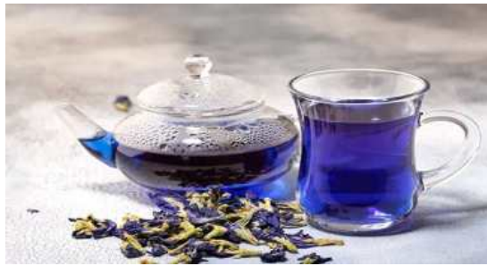
Gol Gav Zaban