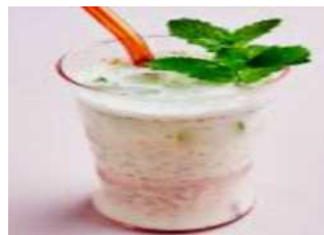
페르시아인 요거트 드링크 Doogh