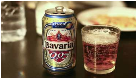
무알코올 맥주 Bavaria