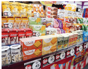
슈퍼마켓에 진열된 한국 스낵