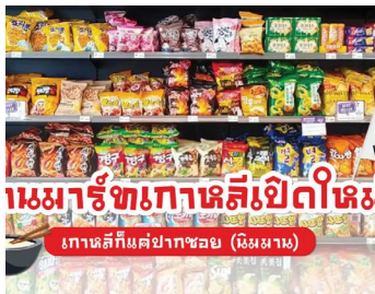
한인 마트 내 한국 스낵 진열대