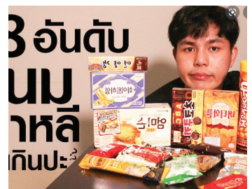
태국 소비자 한국 스낵류 리뷰