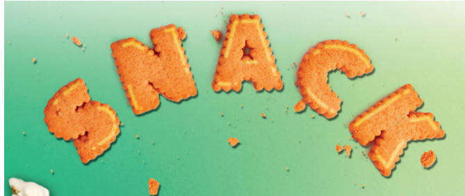
자료 Kasikorn Reserch