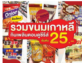
슈퍼마켓에서 진행 중인 한국 스낵 프로모션