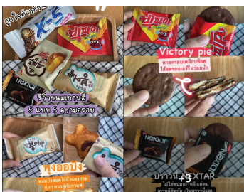
태국 소비자 한국 스낵 리뷰

다. 이러한 이유로 태국에서는 이전보다 한국 스낵류 제품을 먹어보고 싶어 하는 분위기이다. 태국 스낵류 가격을 비교하면 한국 스낵류 가격이 월등히 높은 것이 사실이나 구매 의향이 있는 소비자들에게는 큰 문제가 아닌 것으로 보인다.