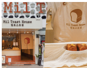
태국에 진출한 한국 베이커리