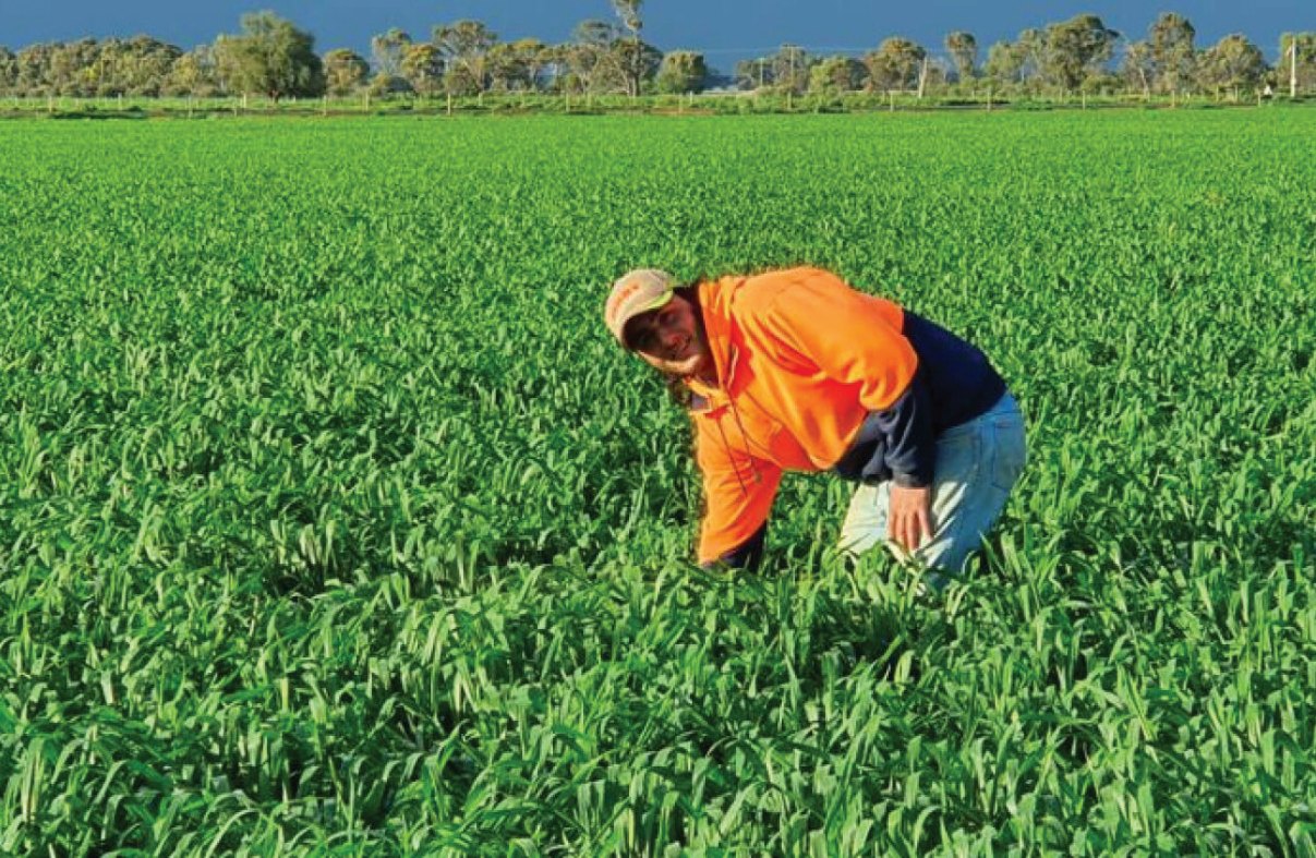
호주 유기농 경작지 전경