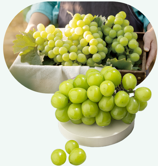
홍콩 포도 수입현황(HS Code : 0806)

농식품 수입의존도가 95% 이상인 홍콩은 포도 생산 또한 미미하기 때문에 99% 수입에 의존하고 있다. GTA에 따르면 2021년 홍콩의 신선 포도(HS code : 0806) 연간 총수입액은 460,639천 달러로 전년 대비 약 16.6% 하락하였다. 2020년 기준 약 38%의 비중을 차지하고 있던 칠레산 포도의 수입은 30% 하락하였고, 약 28%를 차지했던 호주산 포도 수입은 21% 하락하였다. 이는 홍콩에서 중국으로의 포도 재수출액이 2021년 332백만 달러로 전년 대비 약 11% 하락한 여파로 보인다. 하지만, 한국산 포도 수입액의 경우 2020년 대비 약 39% 상승하여 가장 큰 폭의 성장을 보였다. 한국산 신선 포도 수입액 중 90% 이상은 샤인머스켓 품종이 차지하고 있어 수입액 대부분은 샤인머스켓 품종의 실적으로 봐도 무방하다.