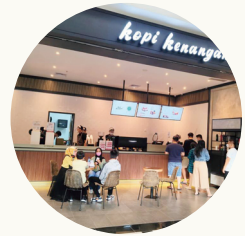
꼬비 끄낭안 카페 전경