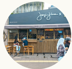
잔지 지와 카페 전경