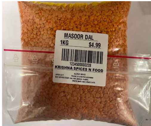
Masoor Daal (500g and 1kg)