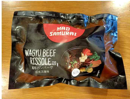
Mad Samurai brand Wagyu Beef Risssole (220g)