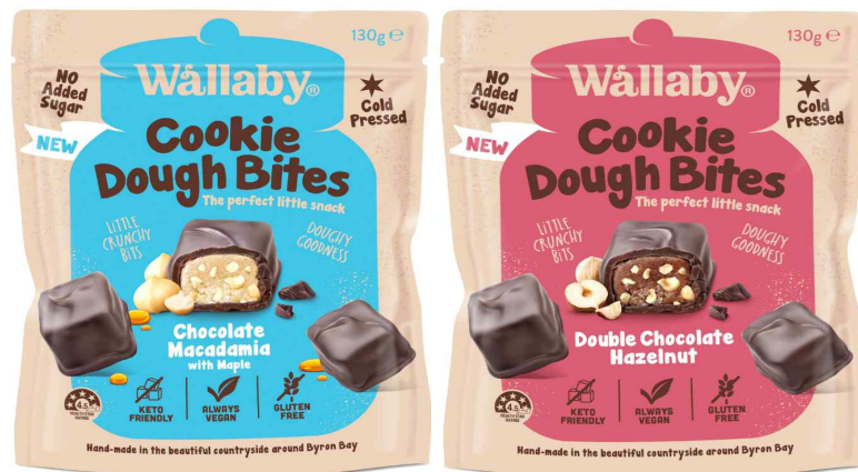
Wallaby brand Cookie Dough Bites Chocolate Macadamia with Maple (130g)