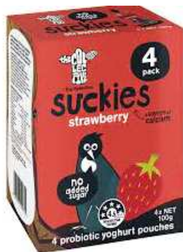
The Collective Suckies Strawberry Kids Yoghurt (4x100g)