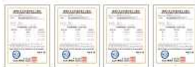
품목별 원산지 인증 수출자 총 12건