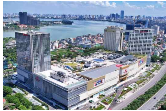
롯데몰 웨스트레이크 하노이