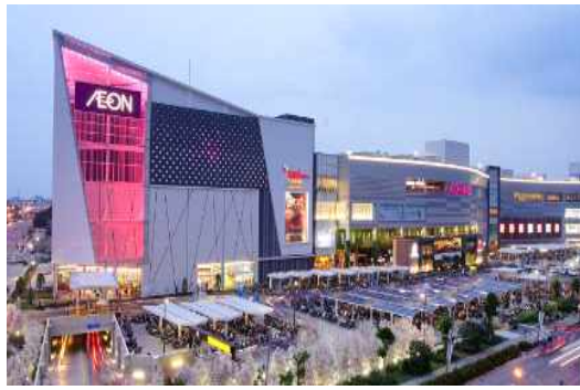
베트남 하이퍼마켓 현황