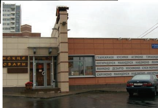
일본식품 판매장 (레스토랑과 동일건물내 위치)