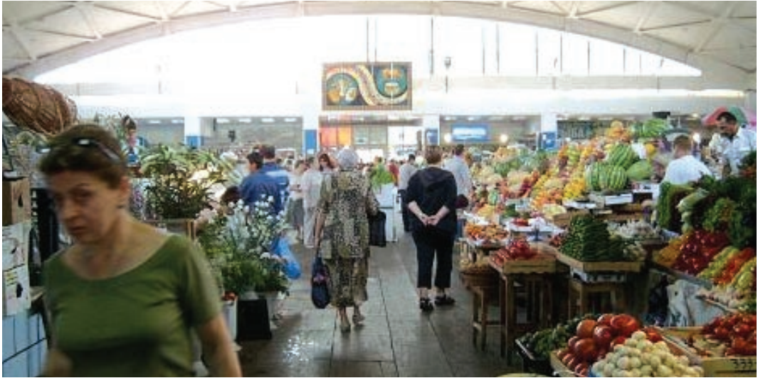
시장 건물내 상품판매 전경