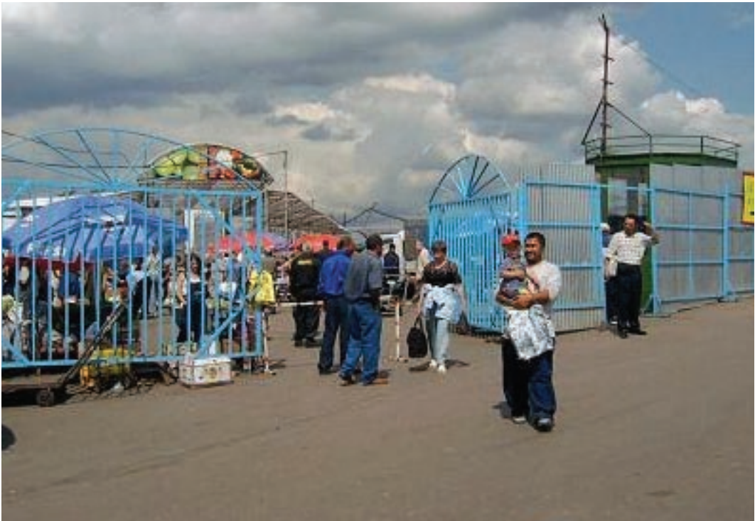
소비자 집하시장 전경