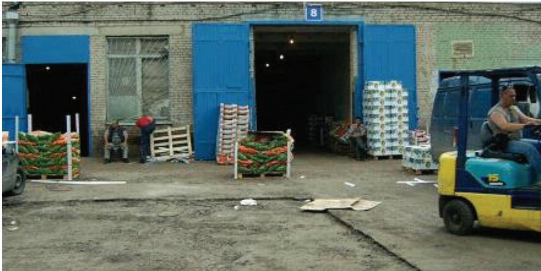
상품 전시대(가판) 설치 소매상 대상 현장판매 실시