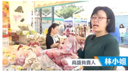
| 참가업체 언론 인터뷰(Apple Daily) |