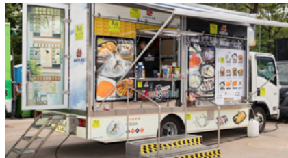
| 푸드트럭 모습 |