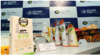
| 한국농식품 미디어데이 홍보 |