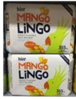
수입 과일맥주(중국, 일본, 싱가포르, 한국)