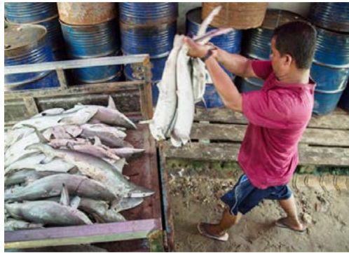
〈하루 수확량을 수레에 싣고 있는 어부의 모습〉