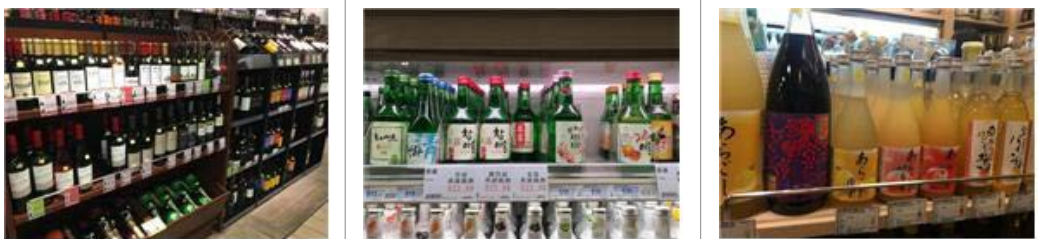
홍콩 유통매장 주류 진열 (와인, 소주, 과일주)