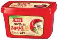
[해찬들 태양초고추장 미국 판매제품]

미국의 아시아 식품 수입유통업체 Savor는 최근 미국에 유행하고 있는 건강 중시 트렌드가 고추장 소비에 영향을 미치고 있다고 밝혔다. 맵고 자극적인 맛을 지양하는 'Clean -eating' 이 유행하면서 고추장과 같은 자극적인 맛의 소스는 판매가 되지 않아 가격을 낮추고 있다고 설명했다.