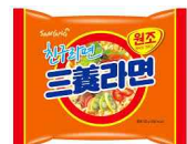
[미국에서 판매되는 한국 삼양라면]

수입 제품을 판매하는 유통매장 Plaza Market의 식료품 판매 담당자와의 인터뷰에 따르면, 한국 본사의 가격 인상으로 라면의 가격이 상승한 것으로 파악되었다. 미국의 수입업체들은 한국 수출업체가 산정한 가격을 그대로 따를 수밖에 없는데, 최근 가격이 올라 소비자들에게도 인상된 가격으로 판매하고 있다. 그러나 가격인상에도 불구하고, 판매는 일정하게 유지되고 있다.