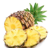
[필리핀에서 주로 수입되는 신선 파인애플]

최근 필리핀을 강타한 태풍 '라이언록'의 영향으로 현재 필리핀의 파인애플 생산이 원활하지 않은 것으로 조사되었다. 파인애플은 신선 소비와 각종 디저트 등 다양하게 활용되고 있어 미국 내 수요가 지속적으로 높는데, 필리핀산 파인애플 수입에 차질이 생겨 소비자 판매 가격이 상승했다.