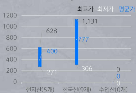
1) 원산지별 장류 중량(100g)당 가격 비교