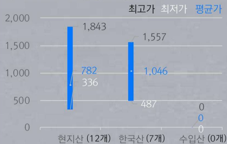
1) 원산지별 라면 중량(100g)당 가격 비교