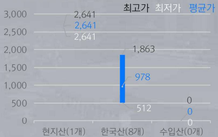
1) 원산지 별 민속주 중량(100ml) 당 가격 비교