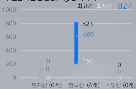
1) 원산지별 김 중량(10g)당 가격 비교