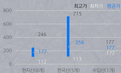
1) 원산지 별 스낵류 중량(10g) 당 가격 비교