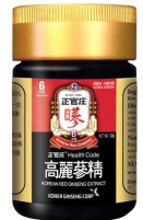
[일본 내 유통 중인 한국산 인삼가공식품]