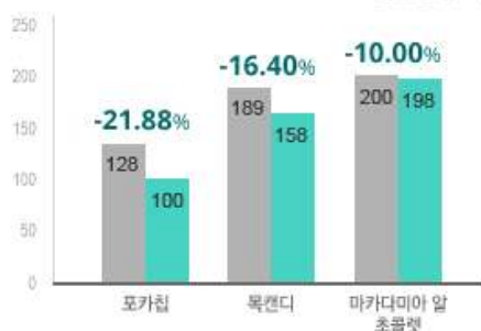
2) 제과류 상승 추이