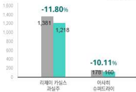
2) 주류 상승 추이