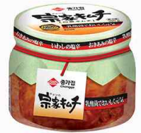
[종가집 김치 일본 판매제품]

Itoyokado의 식료품 판매 담당자와의 인터뷰에 따르면, 건강식품에 대한 지속적인 인기로 김치의 판매는 보합세를 유지하는 것으로 조사되었다. 김치는 대표적인 발효식품으로, 일본에서도 건강한 식품으로 인식되고 있으며, 건강식품의 인기는 당분간 사그라들지 않을 것으로 전망했다. 또한, 최근에는 김치의 종류가 예전에 비해 많아져 판매에 영향을 줄 것이라고 전했다.