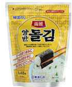
[동원 양반김 일본 판매제품]

한국 제품을 취급하는 일본 수입상 에이치 아이 푸드 주식회사(エイチ・アイ・フーズ株式会社)의 판매 담당자는 최근 김과 미역의 수입 단가가 높아져 수입과 판매가 감소했다고 전했다. 미역은 일본 내 수요 자체도 감소세이며, 김의 경우 인기는 많지만 가격이 비싸 구입을 꺼리는 소비자들이 많은 것으로 파악되었다.