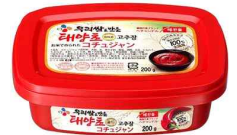
[C] 태양초고추장 일본 판매제품]

한국 제품 수입상인 FIVE E LIFE Co. Ltd은 한-일 양국의 외교문제로 한류에 부정적 영향을 미쳤고, 한국 식품의 수요 또한 감소했다고 밝혔다. 몇 년 전에는 한국 식품이 활발하게 팔리던 것과는 달리, 양국의 정치적인 문제로 한류에 우호적이지 않은 분위기가 형성되어 판매가 감소하는 추세라고 설명하였다.