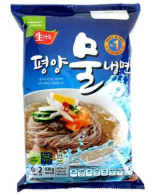
[풀무원의 평양물냉면 일본 판매제품]

일본 식품 도매 유통상 株式会社徳山物産와의 인터뷰에 따르면, 날씨의 영향으로 최근 냉면의 수요가 증가한 것으로 나타났다. 냉면은 여름철 대표 인기 제품으로, 판매가 증가했으며, 차갑게 얼음을 띄워 먹을 수 있어 소비자들 사이에서도 꾸준한 인기를 보였다고 전했다.