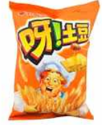
[오리온 오감자 중국 판매제품]

한국 제품을 취급하는 중국 수입상 남경청유식품무역유한공사(南京青柚食品贸易有限公司)의 구매 담당자는 최근 중국의 과자 시장에서는 여전히 허니버터맛 제품이 유행한다고 언급했다. 대표 제품인 해태제과의 ‘허니버터칩’도 인기가 많지만, 한류 연예인들이 광고한 오리온사의 ‘오감자’ 역시 중국에서 인지도를 높여가고 있다.