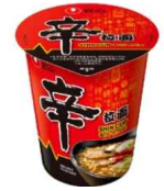
[농심 신라면 중국 판매제품]

중국의 한국 식품 유통상 청도희극무역공사(青岛喜可喜贸易有限公司)의 판매부장은 인기 한국 라면인 농심사의 신라면(农心辛拉面)의 가격이 하락했다고 밝혔다. 한국 신라면은 지속적으로 인기 있는 제품 중 하나이지만, 최근 중국 라면 시장의 경쟁이 심화됨에 따라 가격을 낮춰서 판매하고 있다고 설명했다. 신라면은 중국산 라면에 비해 가격이 높지만, 맛과 품질로 인지도를 확보한 제품이다.