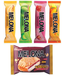
[빙그레社 메로나 아이스크림]

호주 뉴사우스웨일스(New South Wales) 주에 위치한 한국 및 아시아 식품 수입·도매 유통업체인 S & L Global PTY LTD의 직원과의 인터뷰에 따르면, 빙그레사의 메로나 아이스크림의 수요가 증가했다고 밝혔다. 멜론 맛 제품으로 오래전부터 소비자들의 사랑을 받아왔던 제품이 딸기 맛, 바나나 맛 등의 다양한 맛을 선두로 신제품을 출시하자 기존 소비자들의 환영을 더욱 열렬히 받고 있다고 설명했다. 현지 교민은 물론 해외 소비자들의 입맛까지 사로잡은 비결은 과일 맛 재현에 있는 것 같다는 의견을 전했다.