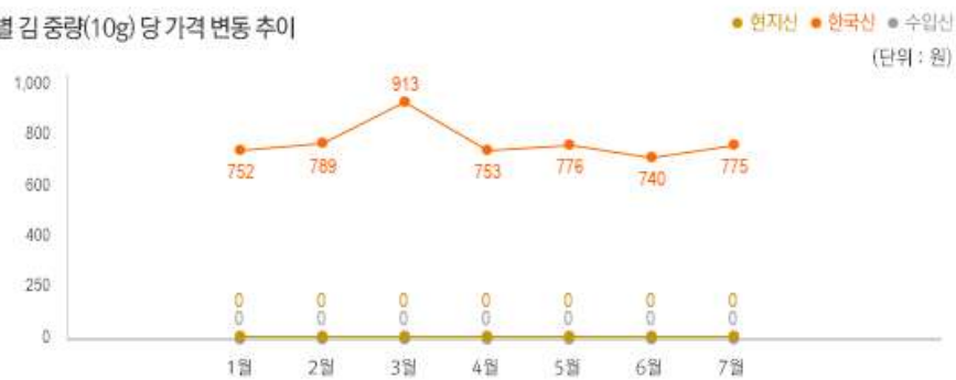
2) 원산지 별 김 중량(10g) 당 가격 변동 추이