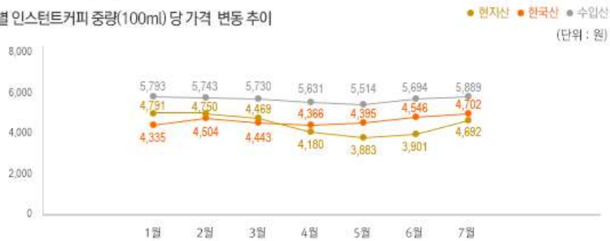
2) 원산지 별 인스턴트커피 중량(100ml) 당 가격 변동 추이