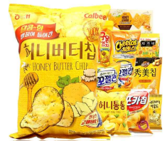
[허니버터 맛 스낵]

호주에서 유명 아시아 식료품점인 Hometown Asian Supermarket의 점장과의 인터뷰 결과, 허니버터 맛을 가진 한국산 스낵류의 인기가 끊이지 않음을 전달했다. 감자칩, 스틱과자, 아몬드 등등 허니버터 맛이 담긴 한국 제품은 호주 현지에도 기존에 유통되고 있던 한국 스낵류 중에서도 인지도 및 선호도가 단연 1등을 차지하고 있다고 전했다. 아기자기한 제품의 패키지가 호주 사람들의 호기심을 자극하고 호주 스낵류와는 차별화된 맛으로 소비자들을 만족시킴으로써 한국산 스낵류 중 최고 인기제품이 되었음을 설명하며 향후 이러한 추세는 지속될 것이라 답했다.