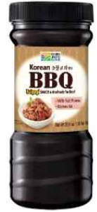
[청정원사 불고기 소스]

퀵랜드에서 온·오프라인 아시안 식료품 소매점을 운영하는 Asian Food 4 U의 직원과의 인터뷰 결과, 한국 청정원사의 불고기 소스(현지 제품명 : BBQ 소스)의 판매량이 계속해서 늘어나고 있다 귀띔했다. 청정원 기업의 제품은 현지 고기 양념용 제품 중 가장 인지도가 높고 판매율 1위를 기록 중인 제품이라 전하며 현지 교민과 더불어 호주 소비자들도 가장 많이 구매하는 상품임을 강조했다. 호주 사람들은 간편식을 즐겨 먹는 경향이 있어 인스턴트 식품에 대한 선호도가 높다고 설명했다. 또한 고기 소비량·섭취량이 높은 호주이므로 인스턴트 면류나 빠르게 요리를 만들 수 있는 조리용 양념 제품의 인기가 높은 이유를 뒷받침했다.