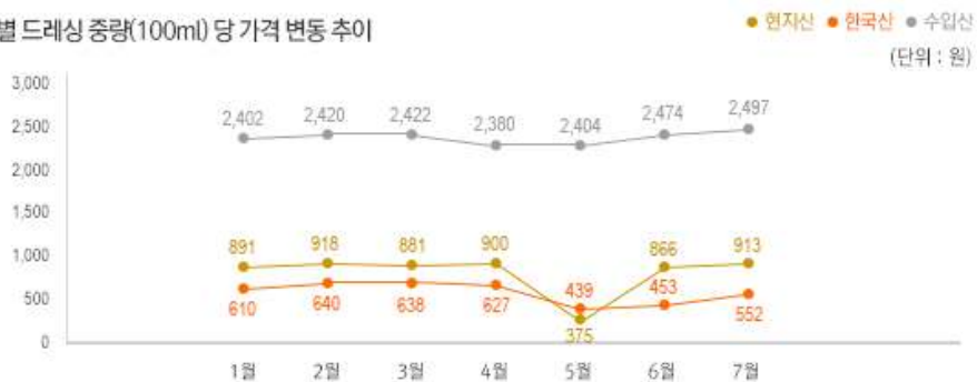
2) 원산지 별 드레싱 중량(100ml) 당 가격 변동 추이

※ 호주 달러의 경우 원화 환산 시 KEB하나은행 7월 28일자 기준으로 작성. 1달러 = 894.22 원